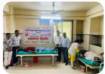
Blood Donation on Doctors Day