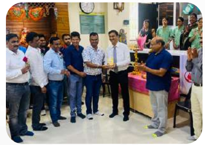
CA & Doctors Felicitation on 1st July