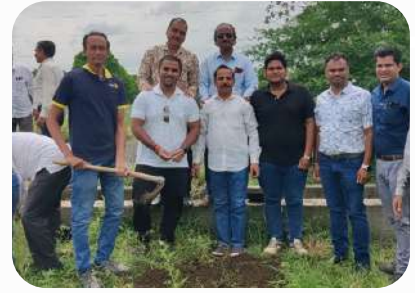
Tree Plantation at Club Property