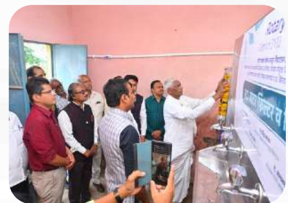
Donation of RO Water Filter & Dispenser at School